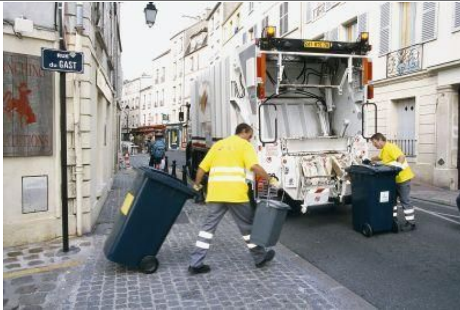
Collecte des déchets (France)

CM2 - THÈME 3 : MIEUX HABITER, la place de la nature en ville, la gestion des déchets, habiter un écoquartier 6e - THÈME 1 : HABITER UNE MÉTROPOLE, la ville de demain