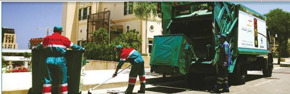
Collecte des déchets (Liban)