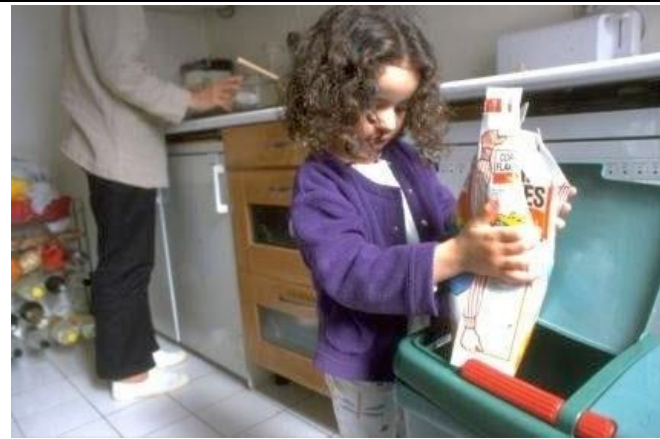
Le tri des déchets à la maison