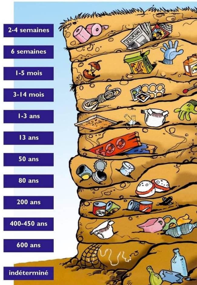
Schéma de biodégradabilité des déchets

CM2 - THÈME 3 : MIEUX HABITER, la place de la nature en ville, la gestion des déchets, habiter un écoquartier 6e - THÈME 1 : HABITER UNE MÉTROPOLE, la ville de demain