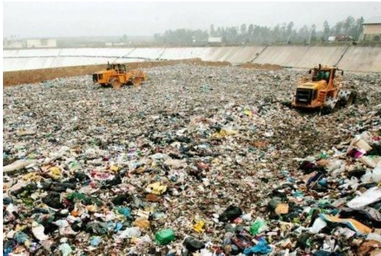
Une décharge dans le Sud-ouest de la France

CM2 - THÈME 3 : MIEUX HABITER , la place de la nature en ville, la gestion des déchets, habiter un écoquartier 6e - THÈME 1 : HABITER UNE MÉTROPOLE , la ville de demain