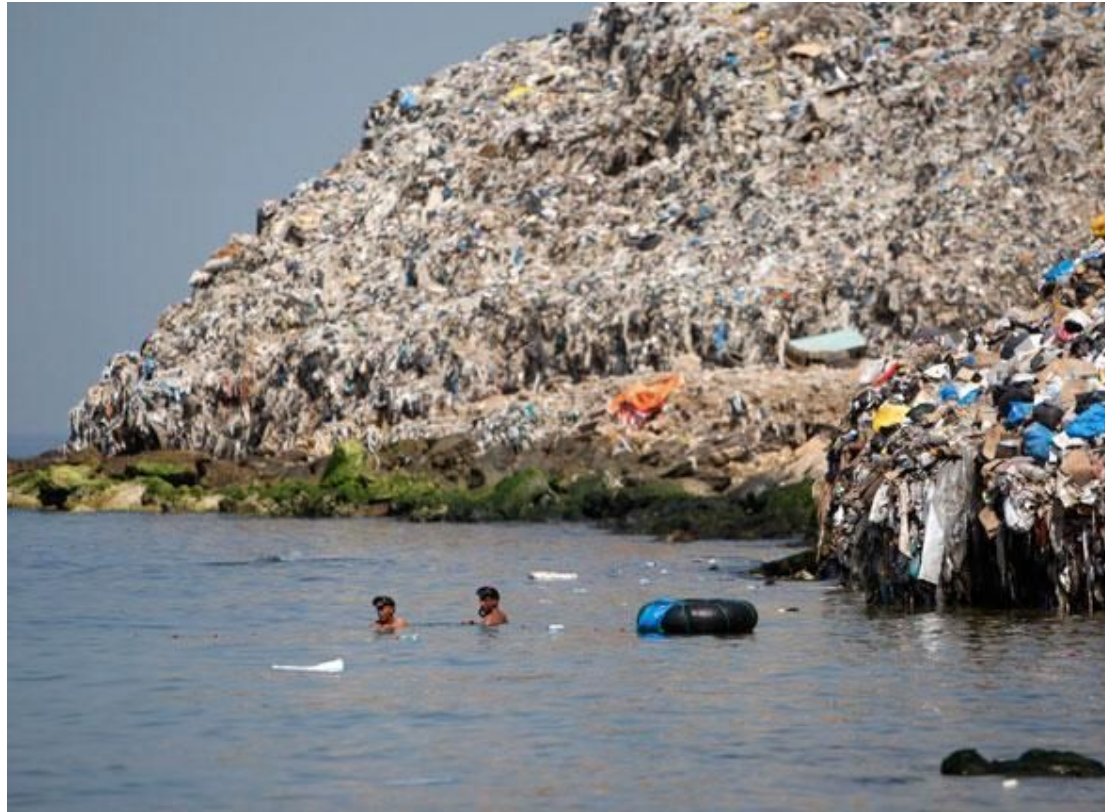
La décharge à ciel ouvert de Saïda en 2009 (fermée en mai 2014)

CM2 - THÈME 3 : MIEUX HABITER , la place de la nature en ville, la gestion des déchets, habiter un écoquartier 6e - THÈME 1 : HABITER UNE MÉTROPOLE , la ville de demain