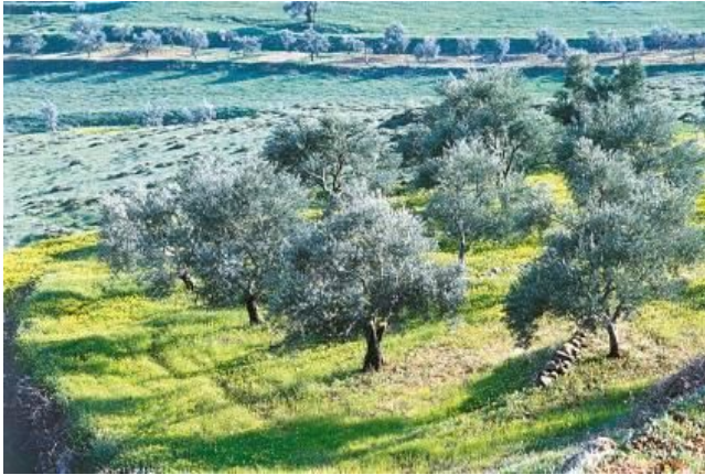
Oliveraie du sud Liban