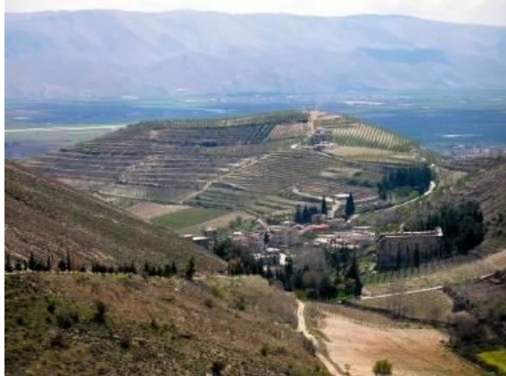
Vignes en terrasses et plantations de fruitiers à Niha autour d'un site romain (au nord-ouest de Zahle) – Atlas du Liban - IFPO