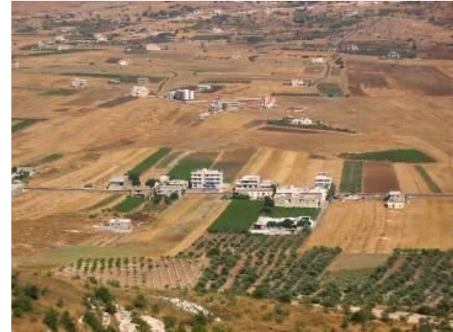
5uZI _b7jX`XMIyjMēZi MM