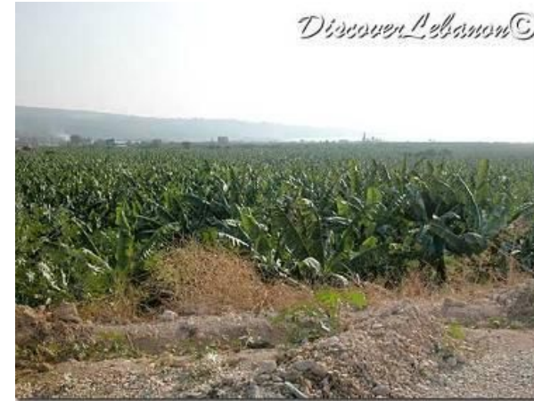
Bananeraies sur la côte à Damour - Liban