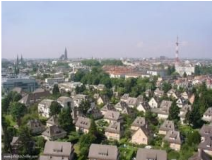
Près de Strasbourg