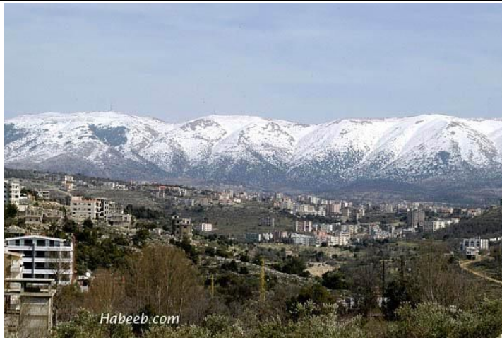
Dans la région du Shouf