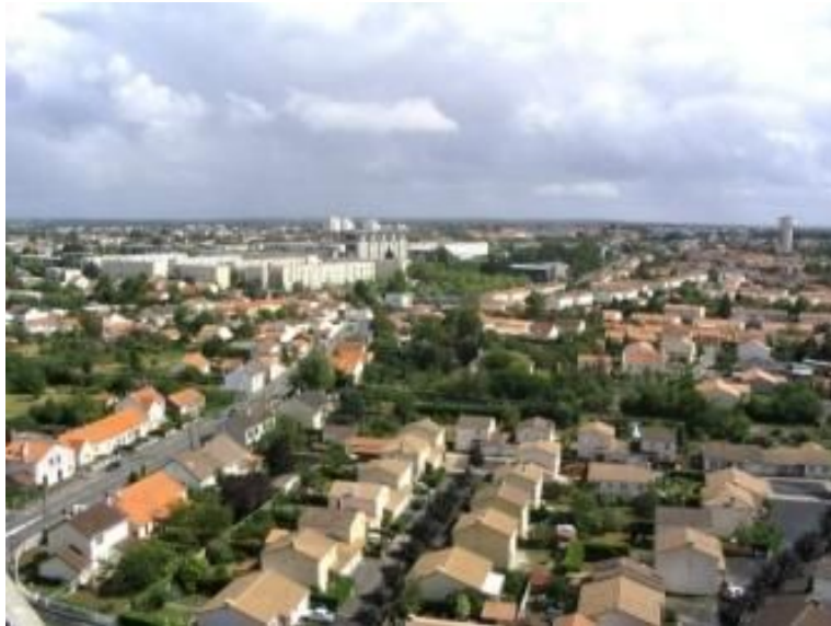
Près de Nantes