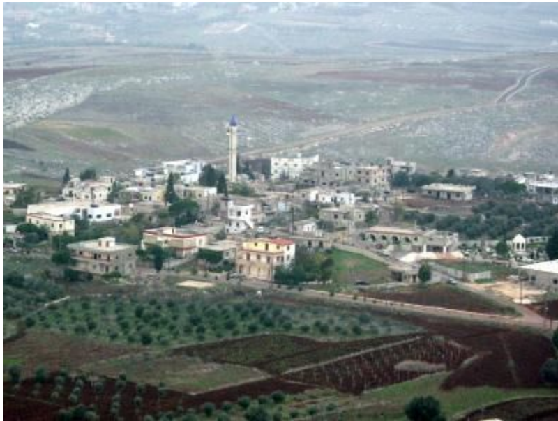
Un village au sud du Liban