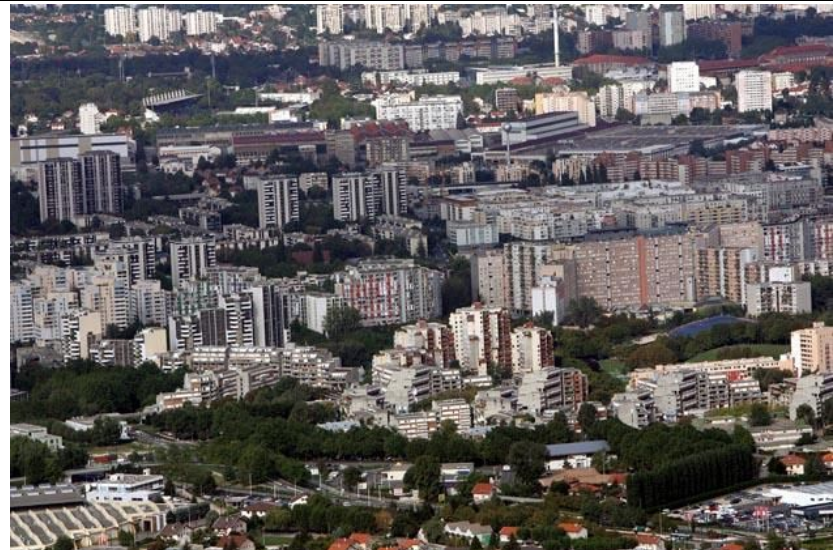
Banlieue de Grenoble