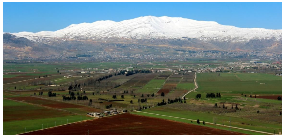
Vallée de la Bekaa