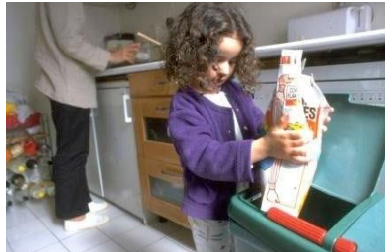
Le tri des déchets à la maison