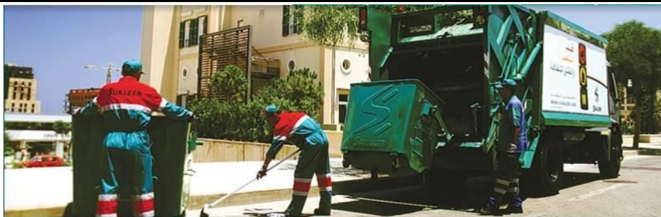
Collecte des déchets (Liban)